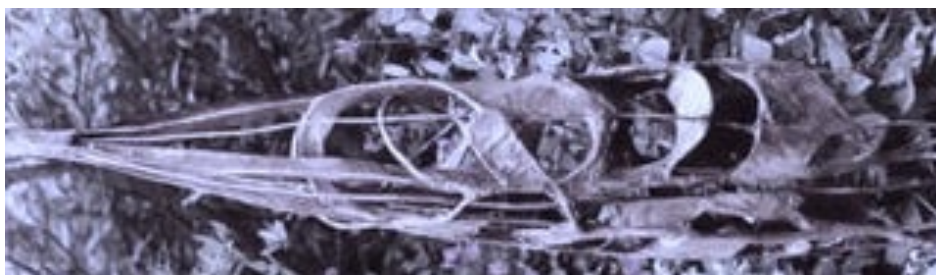
hoogte 120 cm