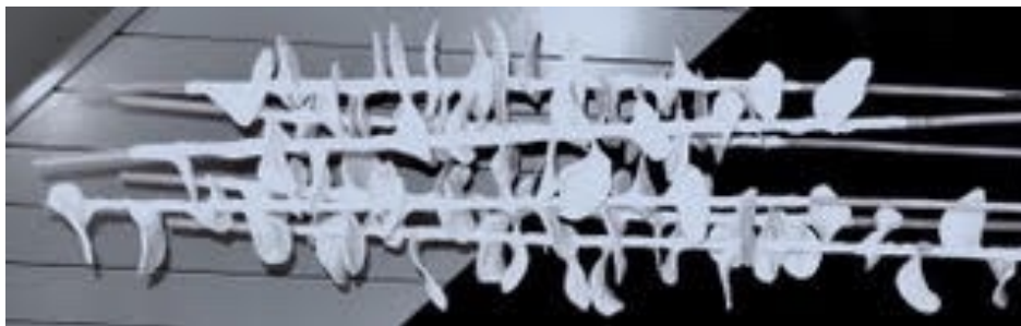
hoogte 210 cm

De kracht van het kwetsbare, laat het ecologische evenwicht van de natuur, waar alles een verband heeft met elkaar blijvend zijn.