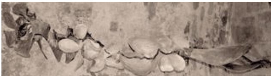
hoogte 190 cm